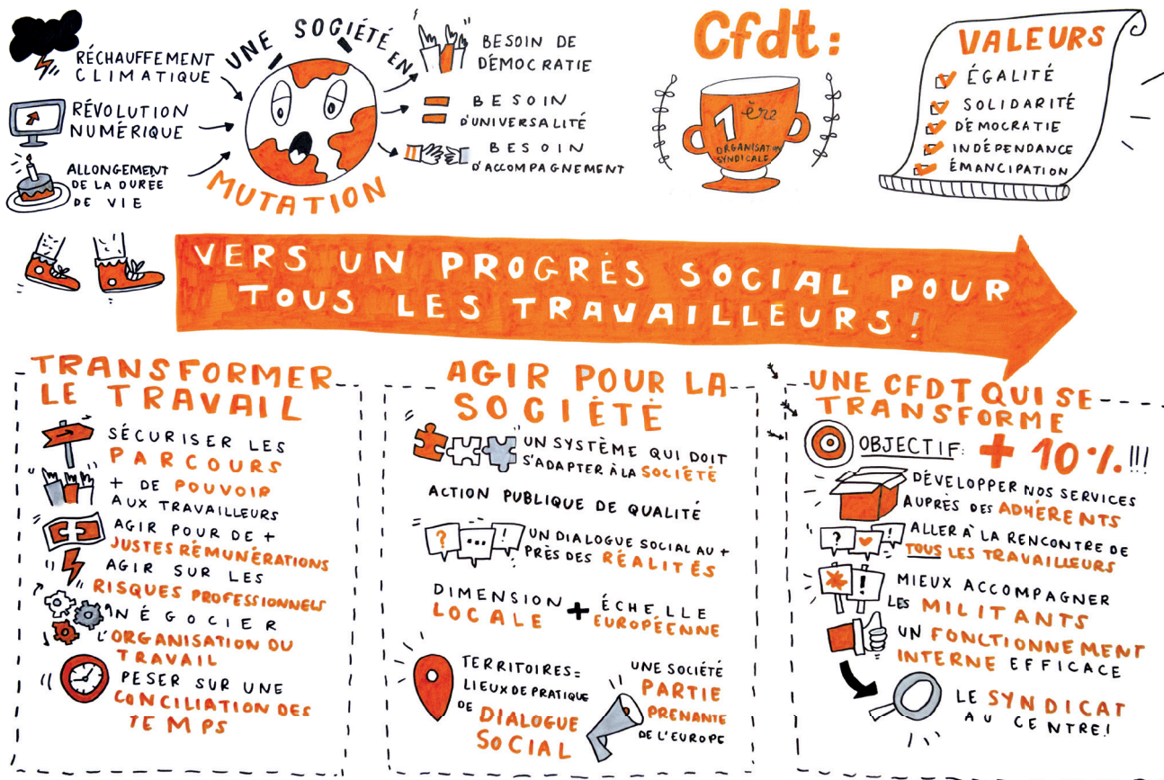
Lors du congrès de Rennes, en juin 2018, l'illustratrice Hélène Pouille a tracé les grands axes de la résolution.

L'accompagnement personnalisé, l'accès effectif aux droits, aux infrastructures et aux services publics sur tous les territoires, la possibilité de se réaliser et de trouver sa place dans la société par le biais d'activités socialement reconnues, sont tout autant importants.